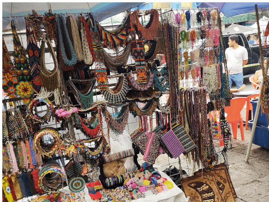
Figura 3. Artesanía de chaquira y de papel amate.